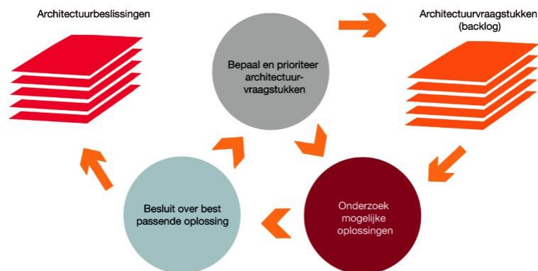
RCDA workflow: een backlog van architectuurvraagstukken vergroot de wendbaarheid

Risk and Cost Driven Architecture (RCDA) is een aanpak die in relatief korte tijd een indrukwekkende staat van dienst heeft opgebouwd, waarmee grote organisaties werden geholpen om hun architectuurwerkwijze te moderniseren. De RCDA-aanpak neemt een aantal aspecten uit agile software-ontwikkelmethodes over. Zo werkt de aanpak met een backlog van architectuurvraagstukken die soms dagelijks geherprioriteerd worden op basis van business-prioriteiten als risico- en kostenbeheersing. Maar waarschijnlijk de belangrijkste les die architecten kunnen leren van het Agile denken is het belang van korte feedback-cycli. Hoe eerder een architect feedback ontvangt op beslissingen of ontwerpen, hoe sneller er geleerd kan worden van het effect ervan binnen de specifieke oplossingscontext – en beter geïnformeerde architecten nemen betere beslissingen.